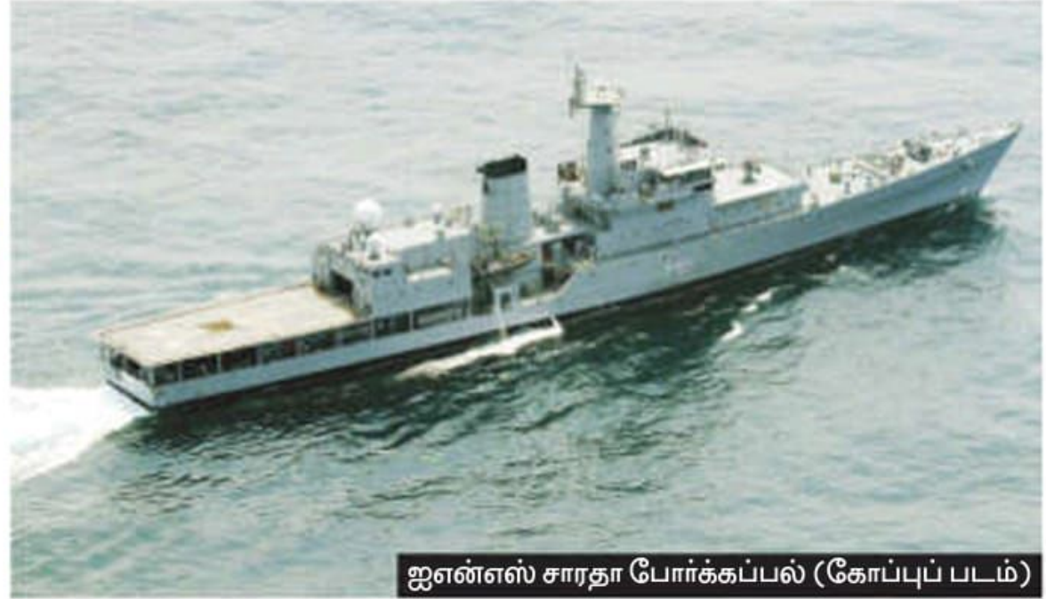
ஐஎன்எஸ் சாரதா போர்க் கப்பல் (கோப்புப் படம்)

கொச்சியில் உள்ள தெற்கு கடற்படை தளத்தை பார்வையிட சென்றபோது கடற்கொள்ளை தடுப்பு நடவடிக்கைகளில் சிறப்பாக செயல்பட்ட 'ஐஎன்எஸ் சாரதா' போர்க் கப்பலின் குழுவினருக்கு தலைமைத் தளபதி ஆர்.ஹரிகுமார் பாராட்டுச் சான்றிதழ் வழங்கினார். ஈரானிய மீன்பிடி படகான 'ஓமரியில்' பயணித்த 11 ஈரானிய மற்றும் 8 பாகிஸ்தானிய மாலுமிகளை சோமாலிய கொள்ளையர்கள் சிறைபிடித்து வைத்திருந்தனர். இதுகுறித்து இந்திய கடற்படை அளித்த தகவல்களின் அடிப்படையில் அப்படகை ஐஎன்எஸ் சாரதா