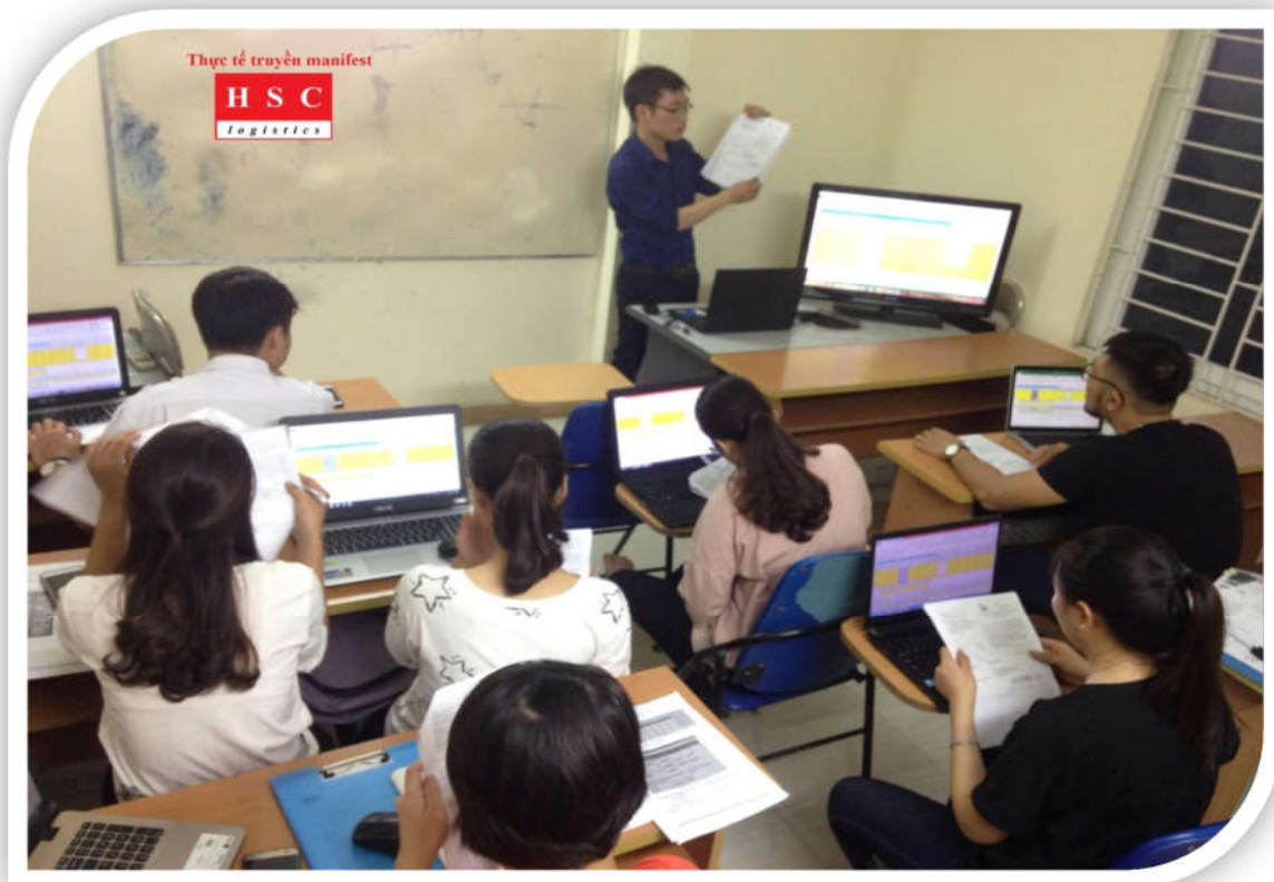
Thực tế cảng vụ, hiện trường

THỰC HÀNH chi tiết trên lớp dựa trên sự chủ động tìm tòi tài liệu từ các học viên