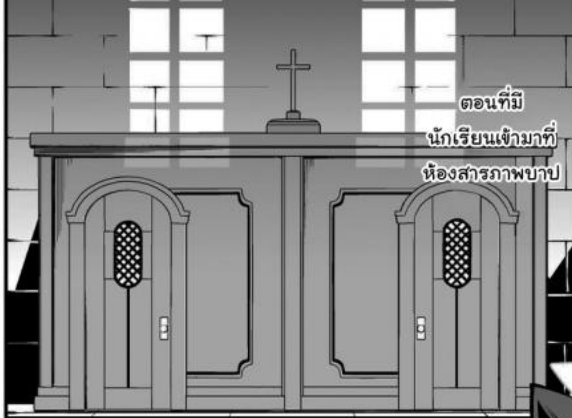
ตอนที่ นักเรียนเข้ามาที่ ห้องสารภาพบาป